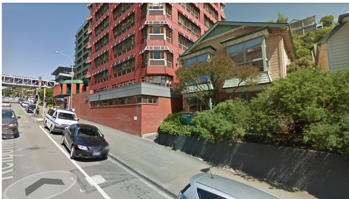
火灾疏散集合地点 (24 Kelburn Parade, von Zedlitz & Murphy 大楼)