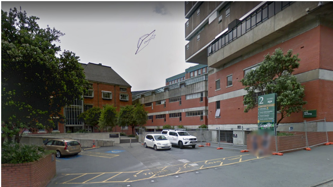
火灾疏散集合地点 (Kirk 大楼)